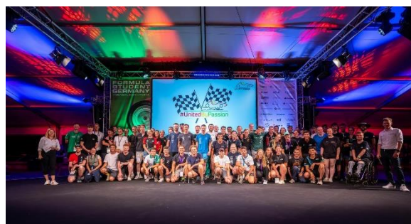
Ein besonderer Moment: Bei der Willkommensfeier 2024 kamen erstmals alle Teamkapitäne gemeinsam auf der Bühne zusammen

Auch in diesem Jahr wird die Formula Student Germany von zahlreichen internationalen Besuchern begleitet, die gemeinsam mit den Teams mitfeiern. Ab Samstag dürfen die ersten Teams ihre Siege feiern, und nach dem Abschluss des „Endurance“-Rennens (Ausdauer) am Sonntag warten die Teilnehmer gespannt auf die Verkündung der Gesamtsieger in den verschiedenen Wertungsklassen bei der zweiten Preisverleihung. Den traditionellen Abschluss des Events bildet erneut die MAHLE Party, bei der das Event in gemeinsamer Freude ausklingt. Die FSG freut sich auf ein Event voller Leidenschaft und Begeisterung.