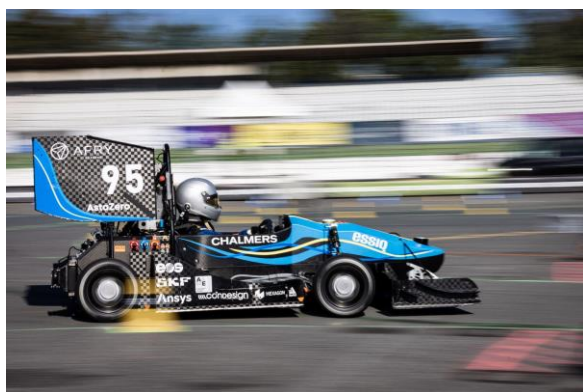
Technische Hochschule Chalmers, Göteborg – Gewinner des Driverless Cups 2023

Seit Montag wird der Hockenheimring wieder durch Teamgeist, Leidenschaft und Können belebt. Die Formula Student Germany läuft bereits auf Hochtouren: Mit 84 Teams aus 20 Nationen zeigt sich erneut, dass die FSG Menschen aus aller Welt mit einer gemeinsamen Leidenschaft auf dem Hockenheimring vereint. Die Formula Student Germany ist ein internationaler Dreh- und Angelpunkt für den Austausch zwischen Studierenden , der Industrie und anderen Wettbewerben.